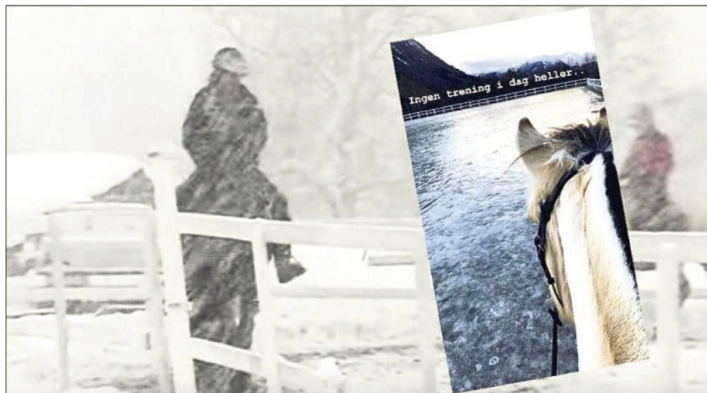
* Når dei får på plass ridehallen på Vollane, slepp endeleg Volda Rideklubb å gå i dvale om vinteren.

len som gjer at klubben tør satse. Økonomien er også god og stabil, fortel leiaren i rideklubben.