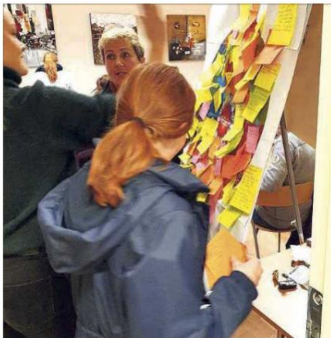
* Ros og konstruktive tilbakemeldingar vart samla inn og gjennomgått.