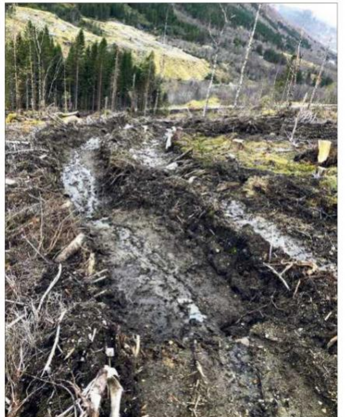
* Frå hogstområdet.