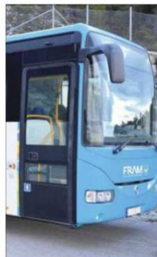
* Ørsta kommunestyre er uroa for konsekvensane av dei nye buss- og rutetilboda i Volda og Ørsta kommunar. (Illustrasjonsfoto)