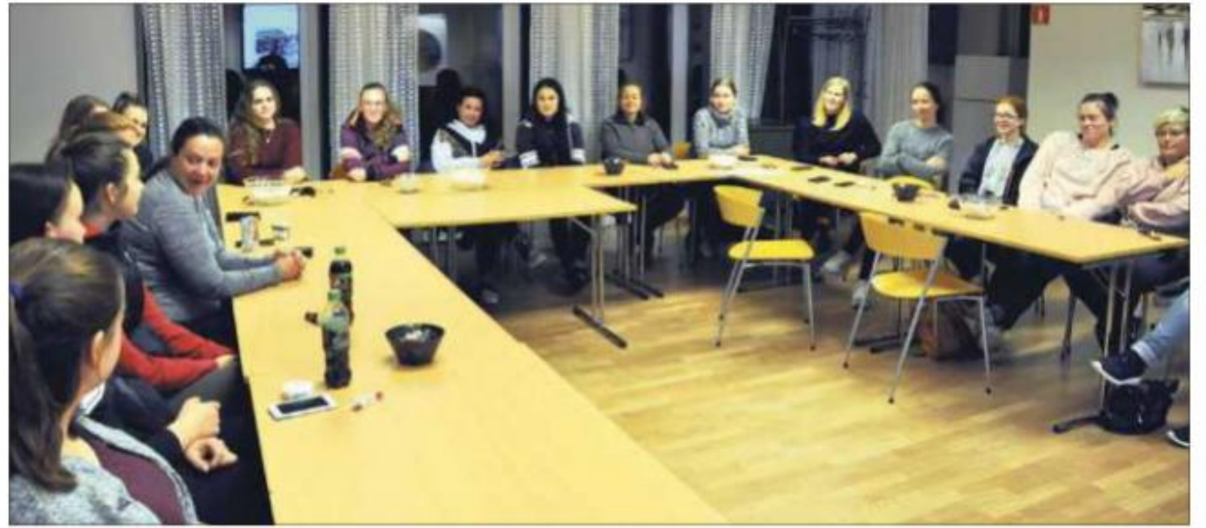
* Dei framømte på klubbkvelden.

– Medlemskvelden vart veldig godt leia av klubbrettleiaren vår, og engasjerte alle som møtte fram, slår ho fast. Ho er også godt nøgd