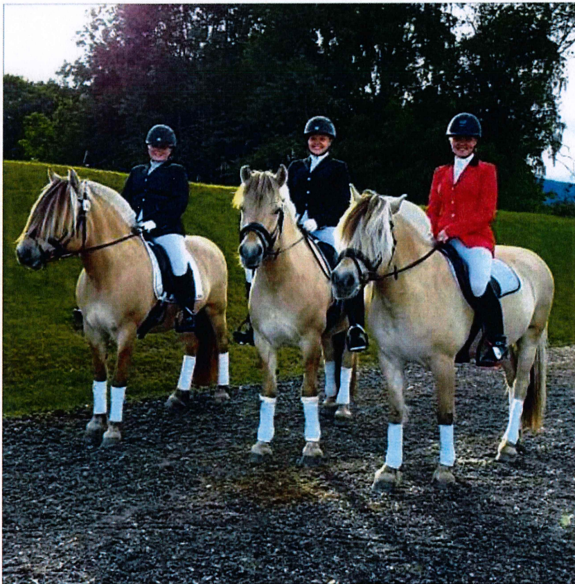
* Dei tre ryttarane frå Volda Rideklubb på plass på Fjordhest NM.

- Vi har alle vore med her før og vi lærer alltid noko nytt så vi