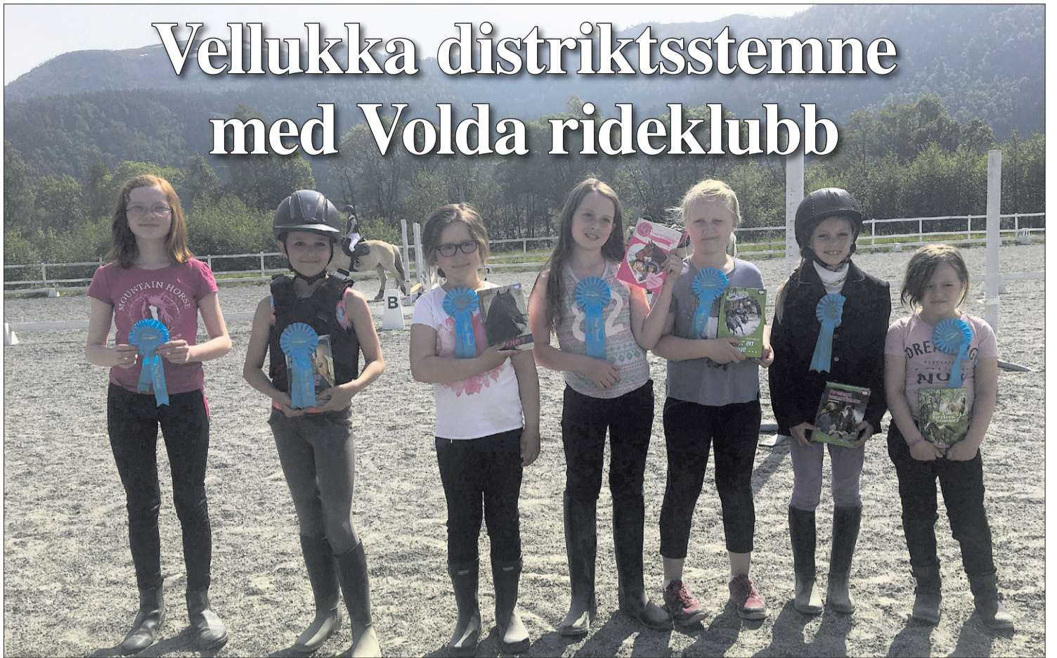
* Fornøgde juniorar etter å ha fullført bom på bakken/20 cm!