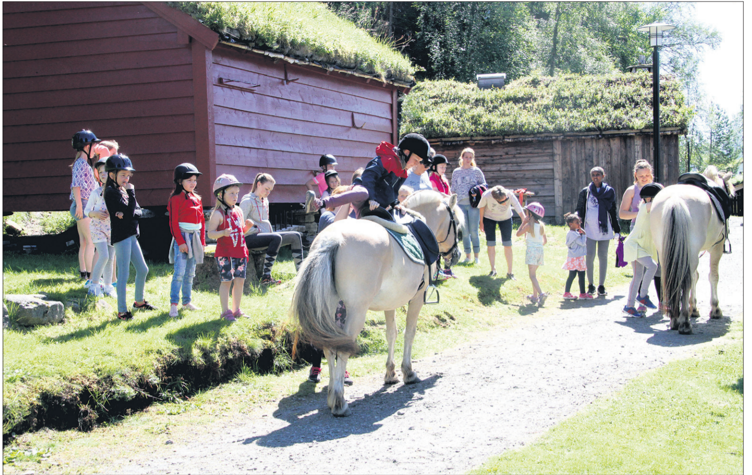
* Ridning på hesterygg var ein av aktivitetane ein kunne oppleve på bygdetunet onsdag.

– Med ei flytting av Språkrådet er det svært høg risiko for tap av kompetanse på område det er vanskeleg å rekruttere ny kompetent arbeidskraft til. Det kjem av at Språkrådet har høgt spesialiserte arbeidsoppgåver på fagfelt der det blir utdanna få nye kandidatar, seier Helleland i ei pressemelding.