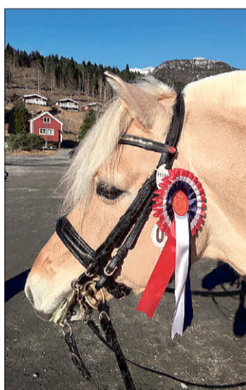
* Den 15 år gamle hingsten Pokemann gjorde ein fin innsats under distriktsstemnet på Nordfjordeid, og tok heim sigeren i begge dei høgaste klassene på stemnet.